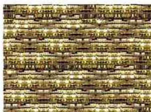
Tania Le Goff, Inside from Outside - Pouillon's Day 1, 2010

Avec ce tirage original numéroté et signé sur Dibond aluminium brossé 3 mm avec châssis rentrant aluminium, Tania Le Goff met en pratique sa passion